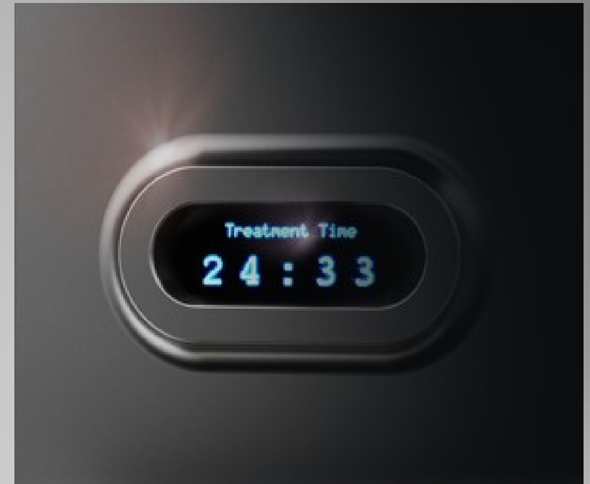
Ecran LCD și buton de urgență pentru pacient