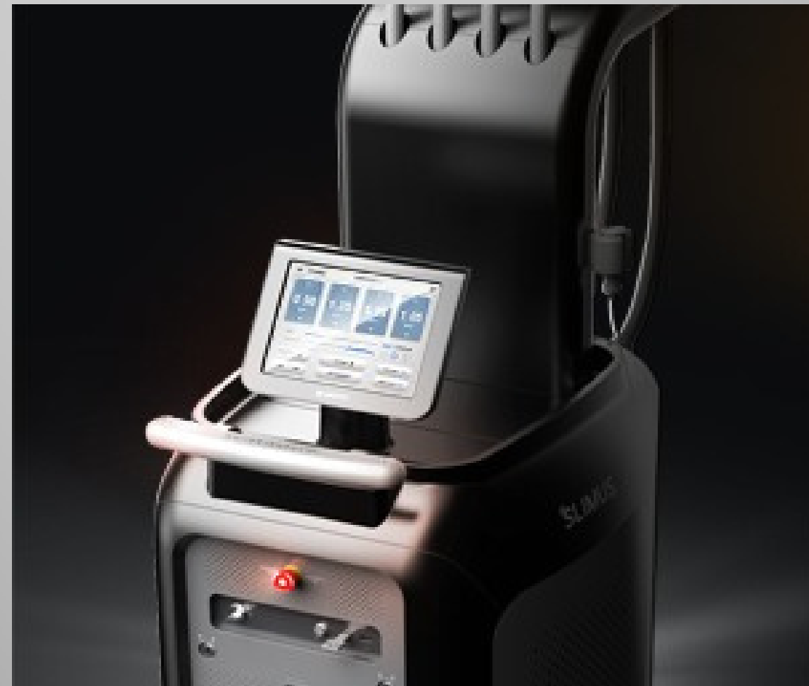
Funcție de instruire vocală